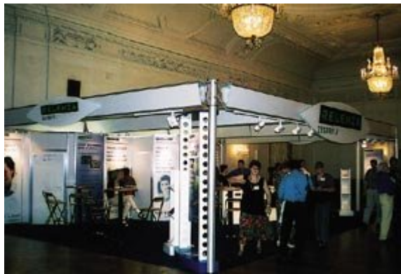
Figur 3 Influenza er viktig for allmennleger!