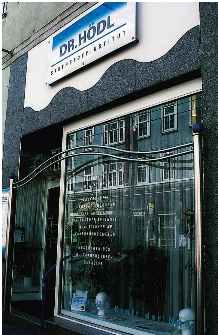
Figur 4 Ifølge vindusteksten gir Dr. Hödl "Sauerstoff-inhalationskuren", "Sauerstoff-intensiv-inhalationen am Fahrradergometer" og "Messungen des Blutsauerstoffgehaltes"