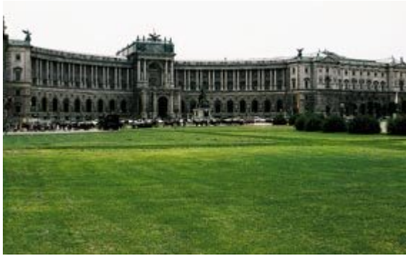
Figur 5 Konferanselokale og tidligere keisersete Hofburg, påbegynt i det 13. århundre

140 000 kvadratkilometer. En svær depresjon fulgte, dernest en tilnærming først til Mussolinis Italia og etter hvert tilknytning til Tyskland (Anschluss) i 1938. Østerrike var delt inn i fire soner etter den annen verdenskrig og ble ikke selvstendig igjen før i 1955 (5).