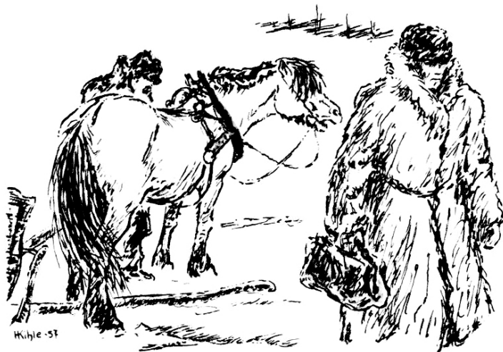
Figur 1 Vesleblakken og doktoren. Illustrasjon Harald Kihle (1905–97) fra 1957. Figur fra Thorbjørn Egners lesebok (4, side 155). Illustrasjon © Harald Kihle/BONO

Historien utspiller seg på den gamle prestegården i Øvre Rendal, Bulls barndomshjem. Det ender med at Ola og Vesleblakken drar de fem milene fra Rendalen til Tynset og henter doktoren på rekordtid. Ola driver hesten så hardt den kalde vinterdagen at Blakken blir knekt og dør – mens gutten blir reddet. Vesleblakkens heltedød er beskrevet som en av de mest tåredryppende historiene i norsk barnelitteratur (6), og legens rolle fremstilles som frelserens: