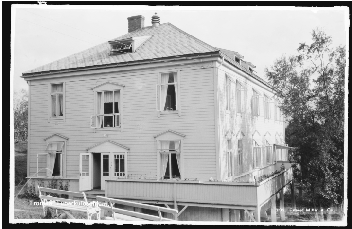
Tromsø Tuberkulosehjem, et av flere tuberkulosesykehus i fylket i den perioden.