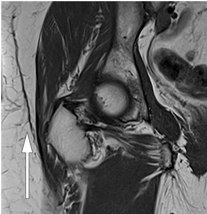
Figur 2 Koronal T1-vektet MR av høyre hofteregion. Mindre restforandringer etter tidligere væskelokulament.