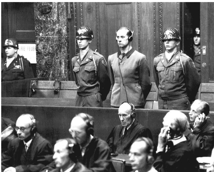
Karl Brandt, Adolf Hitlers da 43 år gamle livlege, ble dømt til døden ved hengning i Nürnbergprosessen.

Teorier om kollektiv ondskap, definert som ondskap på vegne av sosiale/etniske grupper med den hensikt og mot personers vilje å påføre ubotelig skade og lidelse, har flere forklaringsmodeller (3). Mest kjent er teoriene til den polske sosiologen Zygmunt Bauman om distansering og byråkratisering som grunnlag for kollektive overgrep. Essensen i Baumans syn er at nærhet skaper moralske bånd og impulser som må overvinnes for at grupperelatert vold i stor skala skal være mulig. Dette skal ha vært grunnen til at nazistene etter hvert gikk over fra ansikt til ansikt-drap til systematisk utrydning ved gass kombinert med fysisk og ideologisk avhumanisering av ofrene. Distansering ble særlig nødvendig da man etter hvert skulle utføre massedrap også på kvinner og barn i alle aldre (3, 5).