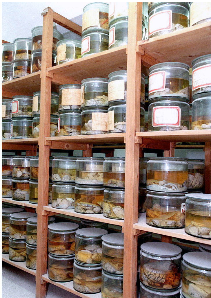
Noen av hundrevis av bevarte hjerner fra barn med fysiske eller psykiske funksjonsnedsettelse som ble drept i nazistenes eutanasi-program.

Den biomedisinske kunnskapen omfatter biologi, kropp, vev og anatomiske strukturer, og i mindre grad kunnskap om det syke mennesket som et følende, tenkende og erfarende subjekt. For å behandle må en lege ha et betydelig fokus på sykdommens årsaker og kanskje i mindre grad på den sykes opplevelse som pasient. En lege helbreder mange ganger gjennom å skade og gjennomfører undersøkelser som er invasive og som kan være smertefulle. Det stikkes og skjæres, hud og slimhinner blottlegges, det kuttes i hudnerver og skrur i ben. Alt dette for å hjelpe. Samtidig må legen trøste den sørgende, informere den som er engstelig og bringe de mest alvorlige budskap til pasient og familie med empati og omtanke.