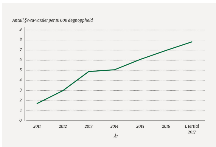
Figur 1 Antall § 3-3a-varsler per 10 000 døgnoophold i perioden 2011-1. tertial 2017. Døgnoopholdene gjelder somatikk og inkluderer ikke dagbehandling, poliklinikk eller døgnoophold i psykiatri og rus. Tallene er hentet fra Norsk pasientregister.