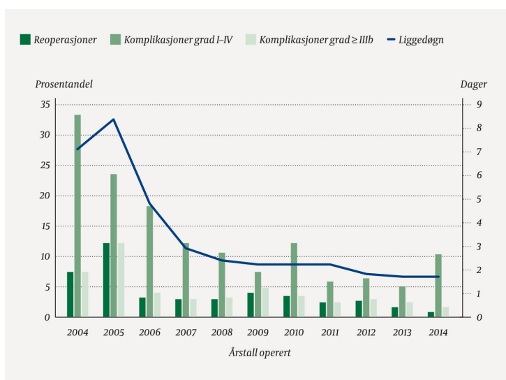
Figur 3 Komplikasjoner etter Clavien-Dindo-klassifikasjonen, reoperasjoner etter fedmekirurgi prosentvis og median antall liggedøgn per år 2004–juni 2014 ved Oslo universitetssykehus (N = 2127 pasienter).