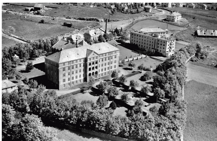
Figur 3 Rogaland sjukehus fotografert i 1951 av Widerøe Flyselskap. Bygningen til høyre for sykehusbygningen er Røde Kors sykepleierskole. Det hvite huset i høyre bildekant er den gamle overlegeboligen.