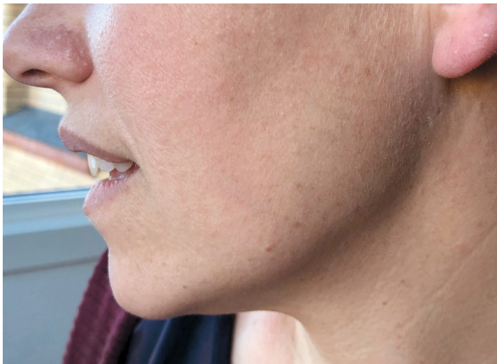
Figur 3 Diskrete fibrofollikulomer i ansikt.

Mens enkelte pasienter kun har noen få fibrofollikulomer, kan andre ha flere hundre lesjoner. Ablativ behandling kan vurderes hvis svulstene oppleves kosmetisk skjemmende, men de kan residivere.