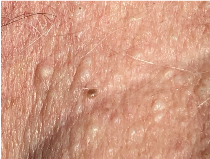
Figur 2 Fibrofollikulomer ved Birt-Hogg-Dubé-syndrom, nærbilde av nakke.

Fibrofollikulomer er benigne hårfollikeltumorer som oppstår hos ca. 90 % av pasientene. Lesjonene består av diskrete, glatte, hudfargede eller bleke 2–5 mm store papler, særlig rundt nese, ører, panne, nakke, hode og på øvre del av truncus (figur 2, figur 3) (7). De debuterer oftest etter 20 års alder og er vanligvis den første kliniske manifestasjonen av syndromet. Lesjonene gir ingen plager, og pasientene oppsøker vanligvis ikke lege.