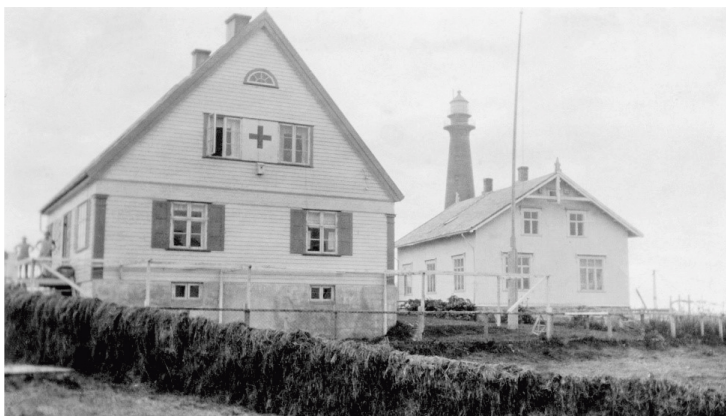
Røde Kors sykestue, Andenes.

Krogstad nevner også at lungebetennelse ofte opptrådte i forbindelse med influensaen og ellers lettere ørebetennelser som gikk tilbake uten behandling. I tillegg var det noen få gastrointestinale tilfeller av influensaen med akutt diaré. Disse forløp relativt lett og varte i 3-4 dager (6). Han skriver videre at «umiddelbart i tilslutning til influenza har jeg set 4 tilfælder av klinisk paaviselig lungetuberkulose. 2 av disse hadde tidligere havd tbc. Pedis, der var i god bedring, men i tilslutning til influenza optrådte en hurtig fremadskreden lungetuberkulose. Hos de 2 andre var der tidligere intet tegn paa tuberkulose» (6).