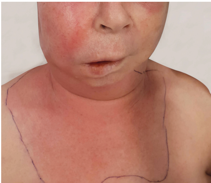
Figur 3 Nekrotiserende bløtvevsinfeksjon utgående fra periapikal abscess på molar i overkjeven på høyre side.

CT med kontrast er nødvendig for å vurdere lokalisasjon og utbredelse av infeksjonen samt å avdekke eventuelt primærfokus som for eksempel periapikale oppklaringer på tannrøtter. Denne kan vise asymmetrisk fasciefortykkelse, gassbobler langs fascieplan, ødematøs muskulatur og bløtvev og eventuell væskeansamling i fascieløsningene som tegn på abscess (13). Rask behandling med radikal kirurgisk debridement av nekrotisk vev og antibiotikabehandling er viktig. Nasjonale retningslinjer anbefaler kombinasjonsbehandling med cefotaksim og metronidazol med eventuelt tillegg av klindamycin (14).