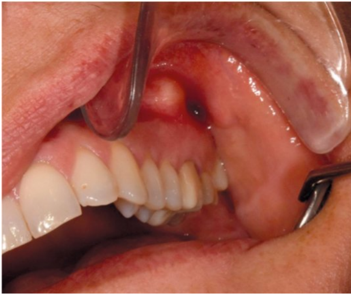
Figur 1 Periapikal abscess fra molar i overkjeven på venstre side.