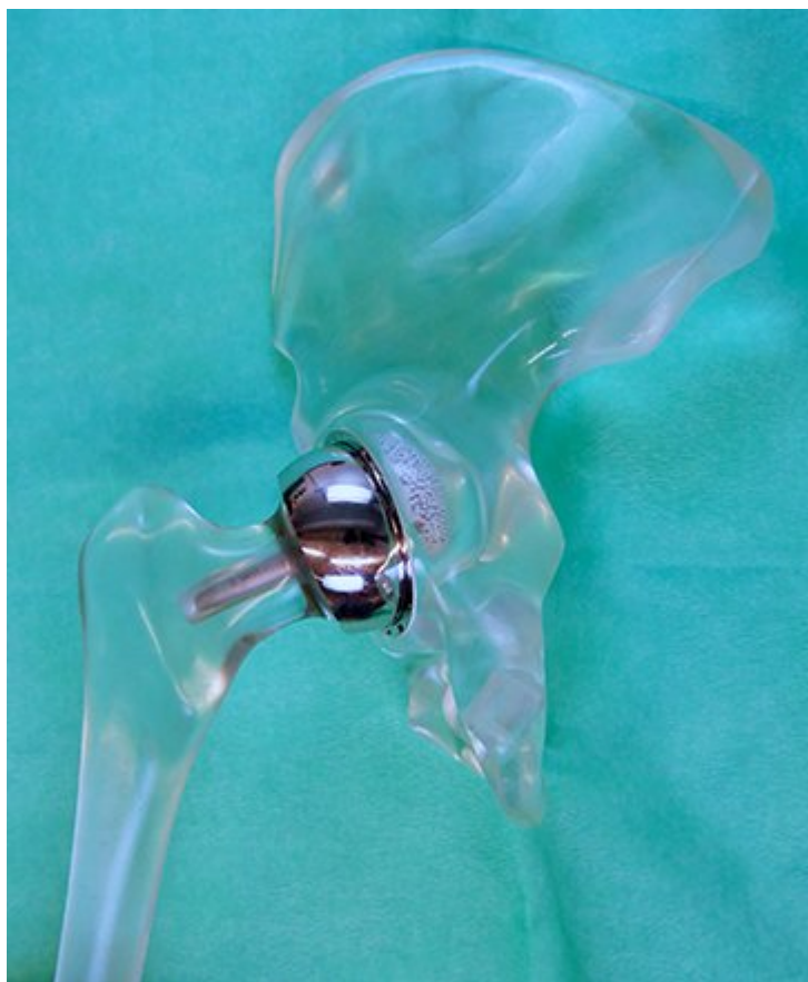
Figur 1 En Birmingham hip resurfacing-skallprotese (Smith and Nephew, Warwick, England), her satt inn i en hoftemodell, har metall-mot-metall-leddflater der «kopp» og «hode» består av en kobolt-krom-molybden-legering med 66 % Co, 26,5–30 % Cr, 4,5–7,0 % Mo, < 1 % Ni, Mn og Fe, og < 0,35 % C, i henhold til ISO-standard 5832.

Mellom 1987 og 2013 ble det ifølge Nasjonalt register for leddproteser satt inn 485 skallproteser i Norge, hvorav 466 BHR-proteser (4, 5). I flere land ble det oppdaget økt forekomst av uheldige vevsreaksjoner som førte til krevende reoperasjon av metall-mot-metall-proteser. Cystedannelse, ofte omtalt som pseudotumorer (6), aseptiske lymfocyttdominerte vaskulitt-assosierte lesjoner (ALVAL) (7) og uønskede vevsreaksjoner fra metallpartikler og ioner (ARMD, adverse reactions to metal debris ) (8) er alle termer som har blitt brukt til å beskrive potensielt skadelige reaksjoner på metallslitasjeprodukter frigjort fra bæreflatene til slike proteser. Revisjonsraten for flere typer skallproteser var høy, dels på grunn av disse vevsreaksjonene, dels på grunn av andre komplikasjoner som lårhalsbrudd og proteseløsning (9). Disse komplikasjonene førte etter hvert til en rask reduksjon i bruken av slike proteser (2). I mange land, inkludert Norge, stoppet bruken av metall-mot-metall-proteser helt i 2013.