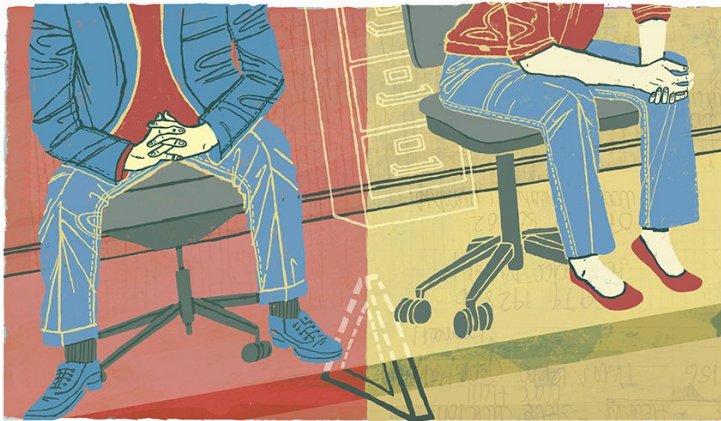
Figur 1 Illustrasjon: Eva Bee / NTB

Høy sysselsetting er en av suksessfaktorene bak den nordiske velferdsstaten. Men for dem som har falt ut av arbeidslivet, kan veien tilbake være lang. Det er på tide å tenke nytt om hva som skal til for å få flere tilbake i arbeid.