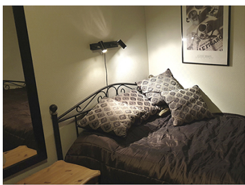
Synsinntrykk venstre øye

En ung kvinne hadde opplevd gjentatte episoder med kortvarig synstap på ett øye og ble henvist med spørsmål om transitoriske iskemiske anfall. Sykehistorien avslørte imidlertid at bakenforliggende årsak var et annet transitorisk fenomen.