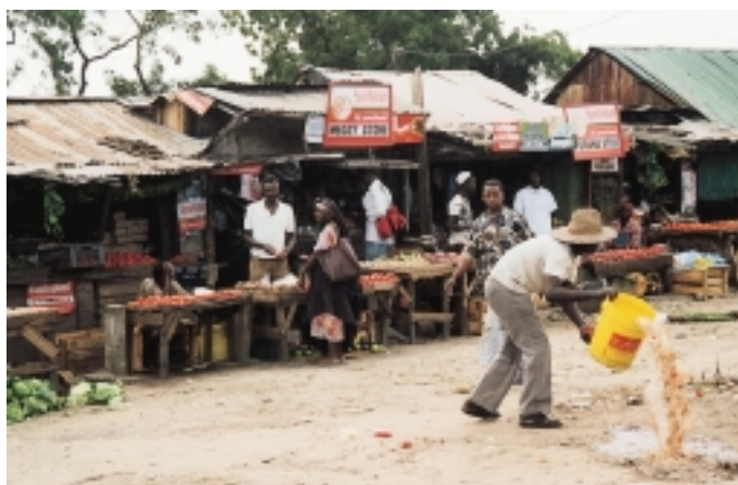
Figur 1 Det er spennende å besøke eksotiske markeder. Det blir tilbudt rikelig med grønnsaker og andre matvarer. Bakteriefloaen er imidlertid en annen enn den vi er vant til og det er også den hygieniske standarden. Enkelte ganger sjenerer man seg ikke for å kaste matrester og skyllevann rett utenfor døren, som vist på dette bildet, tatt i Kenya. Mellom 30 % og 80 % av reisende til utviklingsland blir plaget av diaré, og 10 % får diaré forårsaket av enterotoksinproduserende E coli (ETEC-diaré). Den viktigste forholdsregelen for å unngå reisediaré er fortsatt «kok det, skrell det eller kast det». Kolera-vaksinen gir om lag 70 % beskyttelse i tre måneder mot ETEC-diaré

som er den vanligste årsak til turistdiaré. Beskyttelse er særlig aktuelt for eldre og syke, men kan også være et tilbud til personer som ønsker å redusere risikoen for turistdiaré. Rabiesvaksine anbefales kun i spesielle til-