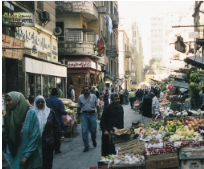
Livlig handel i sidegate i Kairo

Jordan har, som mange av nabolandene fått merke det siste tiårs uroligheter i regio-