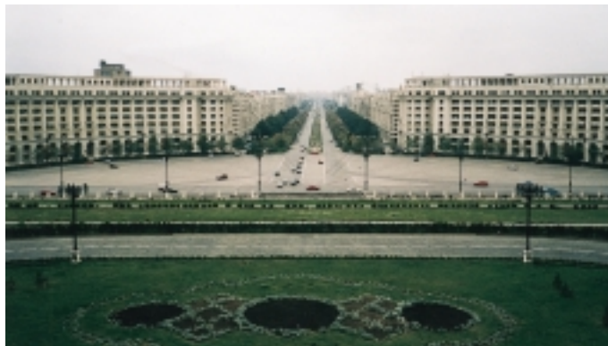
Fra balkongen i Ceausescus palass. Vakker utsikt over «Champs Elysées»

I Midtøsten er det lurt å ha reserveplaner. Ting går ikke alltid som forventet i dette urolige hjørnet av verden. Oppstanden i Israel begynte mens vi nærmet oss regionen, og vi tok ikke sjansen på å dra dit. I stedet startet vi turen i Egypt. I millionbyen Kairo er det lett å bli overveldet. Her er det varmt, fuktig og støvete. Eselkjerrer kjører side om side med svære Mercedes. Små drosjer og store busser prøver å trenge seg forbi deg i rom som ikke finnes, og for å komme seg over veien er det bare å gå rett ut i de små «hullene» i trafikken som finnes for deretter å havne mellom to filer til neste sjanse byr seg for å komme videre. Inne