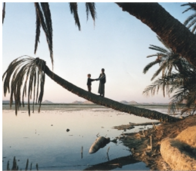
Forbrødring – tysk og egyptisk gutt

Når nøden blir stor, blir det lett grobunn for ekstreme grupper. I et område midt mellom Kairo og Luxor er det svært farlig for turister å ferdes, og togene på strekningen har bevæpnede vakter. Her er utspringet for gruppen som massakrerte en sveitsisk turistbuss i midten av 1990-årene. Fundamentalisme gror der mat, arbeid og fremtidshåp mangler.