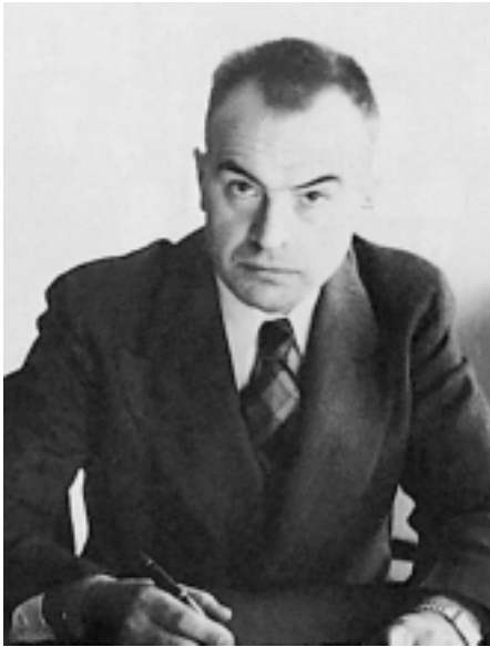
Figur 3 Karl Evang fikk flyktningssaken som en av sine første oppgaver som nyutnevnt medisinaldirektør i 1939.

begrepet «nødsarbeid» uttrykte en sterk antisemittisk holdning (35).