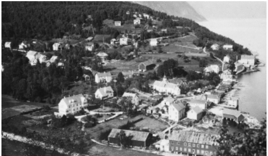
Det var ei vakker, lita bygd dokterparet kom til i 1924. Hotellet og doktergarden på Stranda fremst til venstre.