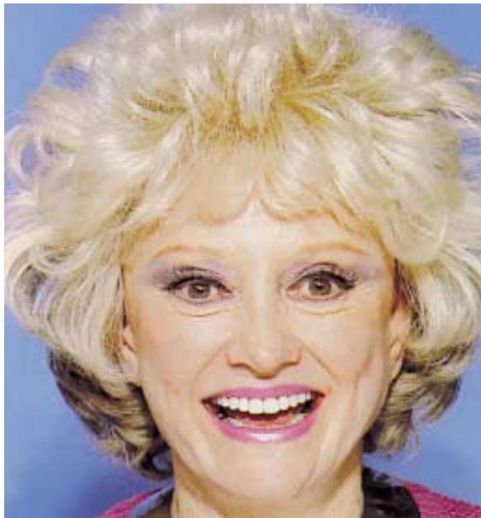
Et ungt og flatterende resultat... (1)

som en form for «egenomsorg». En slik form for ansvarstaken for egen helse og eget liv kan imidlertid resultere i en redusert terskel for symptomopplevelse, og og bidrar dermed til å fylle venterommene og tannlegestolene. Idealproduksjonen og den snevre estetiske standardiseringen av tenner og smil er med andre ord nær knyttet til kommersielle interesser.