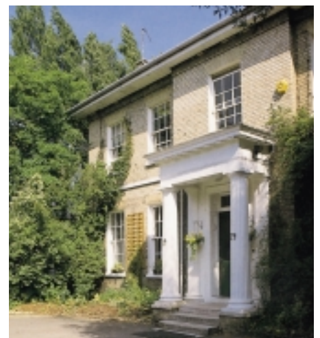
Colchester English Study Centre (CESC) i England hvor språkkurset finner sted. Brosjyrefoto