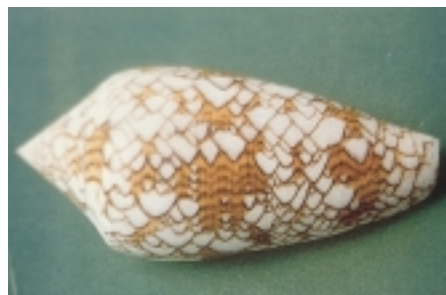
Figur 2 Conus textile , disse vakre og livsfarlige sneglene, kan man få lyst til å ta opp når man snorkler (fra Gopalakrishnakone (3))

nakensnegler adopterer nesleceller fra nesledyr de har spist, og neslecellene transporteres da til sneglenes overflate.