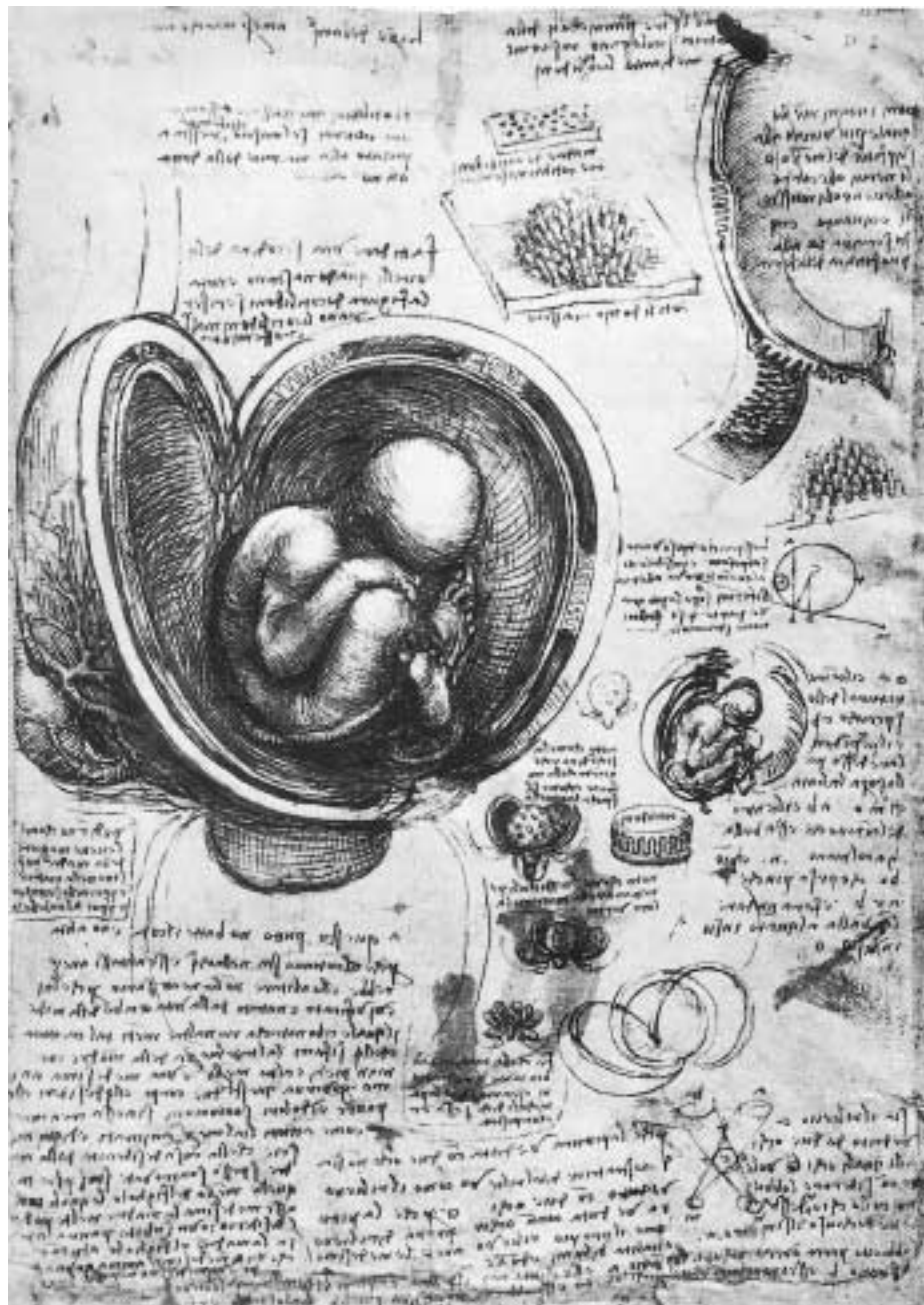
Figur 2 Leonardo da Vinci (Quad. Anat. III fol 7r). Eksempel på Leonardos utnyttelse av notatark (4)

Men hvilket makabert foretagende det var, disse disseksjonene! Leonardo måtte gjøre dette i smug om natten, for Kirken ville ikke vite noe av det. Leonardo måtte gå med sitt blafrende lys ned i de mørke, skitne og stinkende middelalderse likkjellerne, blant rot-