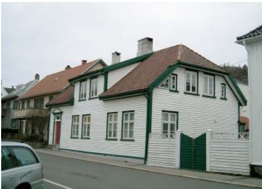
Figur 2 Dr. Deegens hus slik det ser ut i dag.

Huset er rikelig utstyrt med dekketøy og kjøkkenutstyr og sengeklær. Både Deegen og hans kone har vært svært velkledde. Han har ikke mindre enn sju komplette kledninger med kjole, vest og bukser, mange mansjettskjorter, sko- og knespenner av sølv. Hun har mange forskjellige fargede kjoler i damask og «Carton», og i en skuff har hun