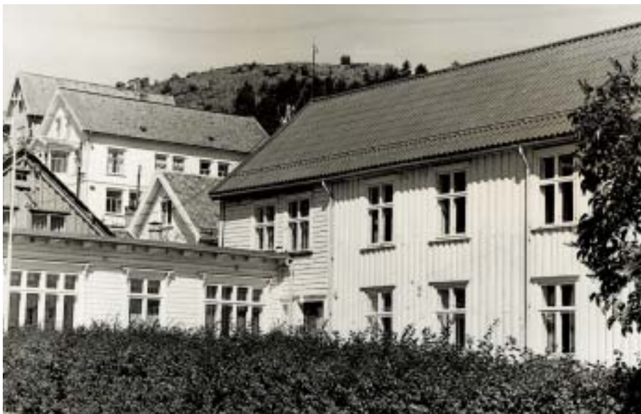
Figur 3 Radesykehuset fotografert i 1975.

en hel del smykker og «Fruentimmerstads», samt en gullbeslått lavendelflaske (10).