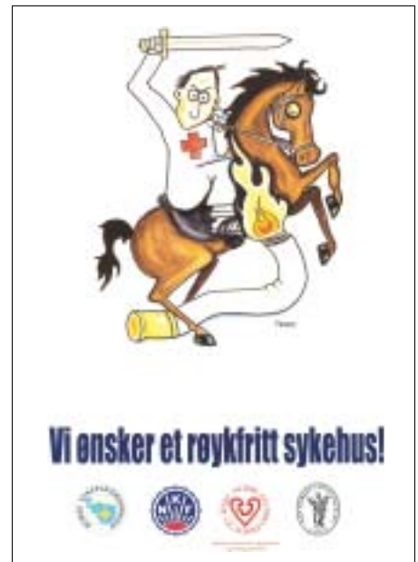
Eksempel på kampanjematerieil som nå er sendt alle sykehus