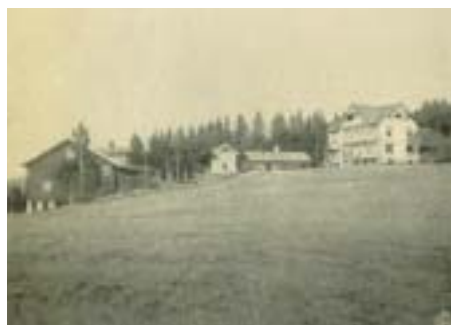
Illustrasjoner var nå blitt en viktig ingrediens, som her med et fotografi av Norske kvinders sanitetsforenings pleiehjem for tuberkuløse ved Grorud.