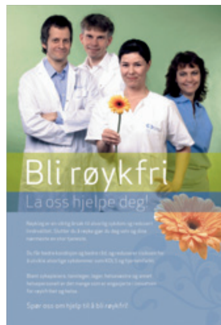
Denne plakaten får allmennlegene og spesialistene tilsendt før 31. mai