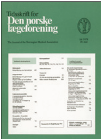
Figur 4 Forside nr. 14/1979