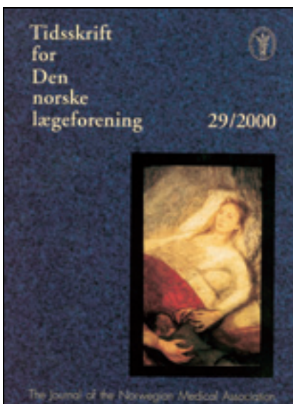
Figur 7 Forside nr. 29/2000