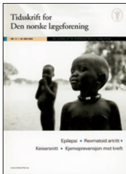
Figur 8 Forside nr. 11/2003