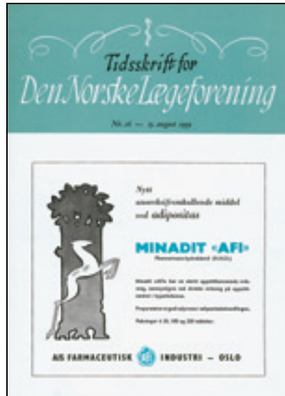
Figur 2 Forside nr. 16/1959