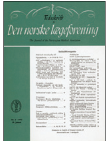
Figur 3 Forside nr. 1/1973