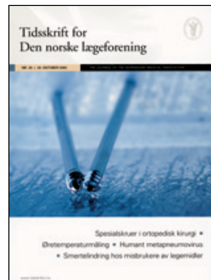
Figur 9 Forside nr. 20/2005