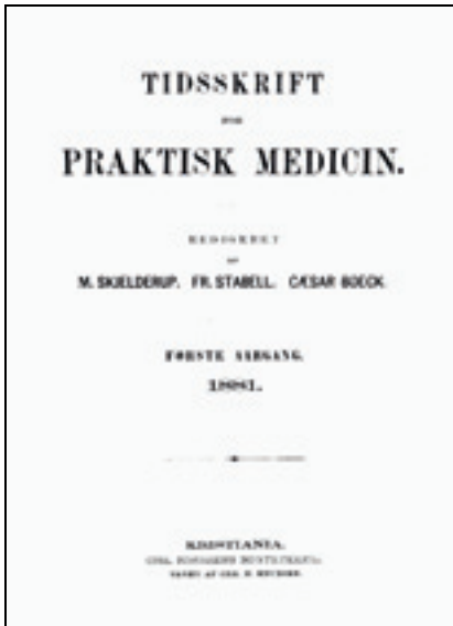
Figur 1 Forside nr. 1/1881