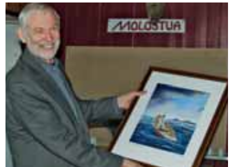
En smilende Nordlandsdokter mottar prisen.

– Men viktigere enn de formelle tingene er hans evne til å gi gode råd, samt forstå alle vansker og utfordringer en ung og fersk lege kan stå i. Han utstråler en trygghet som sier at det er lov ikke å være perfekt, ble det sagt om prisvinneren da han mottok prisen