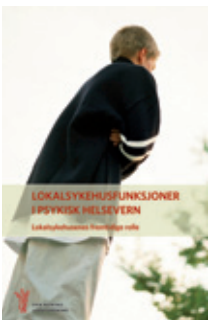
Faksimile av statusrapporten

Én av fire nordmenn tror ikke de vil få den helsehjelpen de vil ha behov for dersom de skulle få en psykisk lidelse. Det viser opinionsundersøkelsen som ble presentert på landsstyremøtet.