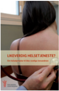
Faksimile av statusrapporten

ikke søker lege. I tillegg vet vi fra en undersøkelse utført av Statistisk sentralbyrå at 18 % av innvandrerkvinnene og 7 % av mennene mener de behersker norsk dårlig, sa hun. I Legeforeningens 10-punktsprogram vil foreningen blant annet at det