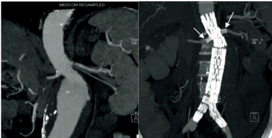
Figur 2 Aneurisme med kort hals, før og etter innsettelse av fenestrert transplantat. Festesonen er forlenget ved å lage vinduer for nyrearteriene. Nyrearteriene er stentet (piler).

urgi ville bedre resultatene for pasienter med høy operasjonsrisiko. Det ble etter hvert rapportert om høyere postoperativ mortalitet hos denne gruppen, og i en studie randomiserte man pasienter bedømt til å ha for høy risiko for åpen kirurgi til endovaskulær behandling eller observasjon. Man fant en høy mortalitet i begge gruppene og ingen forskjell i overlevelse (32).