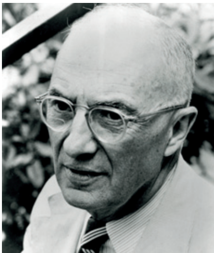
Forfatter, poet og lege William Carlos Williams fotografert i 1950-årene.

Williams har selv skrevet og publisert tekster om livet som lege og forfatter, f.eks. byr kapitlene Of medicine and poetry og The practice fra hans selvbiografi på interessante observasjoner og tanker (2). Han skrev også litteratur med utgangspunktet i sine erfaringer som lege. Noen av disse tekstene er samlet i The doctor stories (6), som inneholder 13 noveller, seks dikt og et utdrag fra hans selvbiografi. Tekstene gjenspeiler Williams' knappe og klare stil der han beretter om sårbarheten og dilemmaene som kan oppstå i møtene mellom lege og pasient.