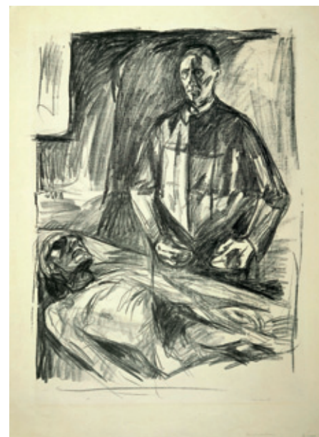
Edvard Munch (1863–1944) utførte flere portretter av anatomen Kristian Schreiner (1874–1957). På ett av dem ligger Munch på disseksjonsbenken med Schreiner ved siden, klar til å starte undersøkelsen (1928–29). Litografi. Munch-museet. Copyright Munch-museet/Munch Ellingsen gruppen/BONO 2010

Forakten for det kronologiske perspektivet gjør at forfatteren også har interessante blikk på samtiden. Før 1900-tallet var disseksjon omgitt av moralske forbud. Disseksjonen av kroppen brøt med forestillinger om døden som noe hellig, mystisk og uangripelig. På 1500-tallet oppfattet man disseksjon som en straff, en skjebne verre enn døden, selv om den skulle tjene en hensikt som lærestykke for medisinen. Når kriminelle ble dissekert,