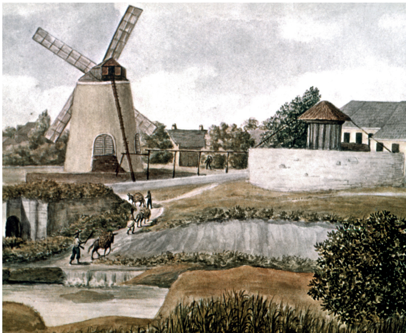
Sukkerplantasje på St. Croix. Akvarell av Peter C.F. von Scholten (1784–1854).

Forfatteren gir et veldokumentert innblikk i en interessant del av kulturhistorien. Illustrasjonene er velvalgte, og han refererer til et stort antall trykte kilder og til et meget omfattende og variert arkivmateriale i Danmark, USA og Vestindia. Han nevner også et stort