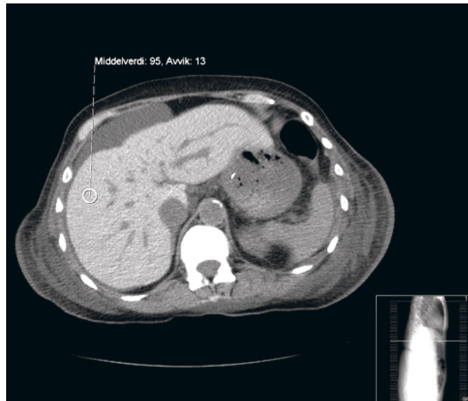
Figur 3 CT abdomen uten kontrastmiddel. Bildet viser høy attenuasjon i lever, som ved jernavleiring [dette til sammenlikning med figur 2]