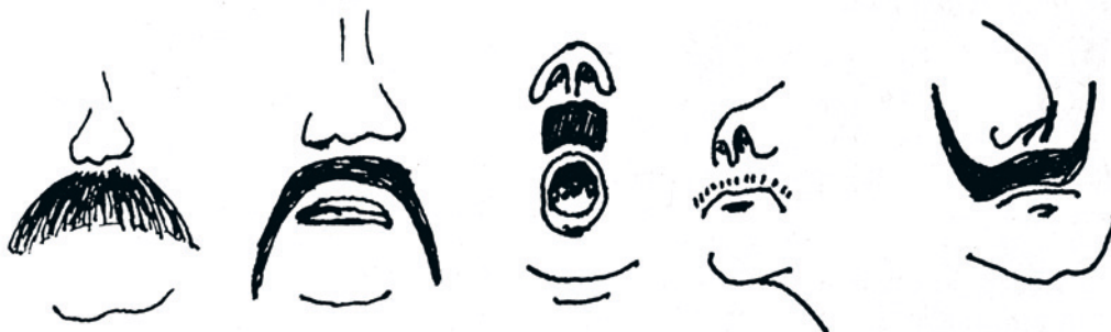
Fig 2. Noen avarter av varianten bart.

Etternølerne fant da ofte på forskjellige begrunnelser for skjegget. Det kunne være man mente ansiktet kunne strammes opp med litt skjegg. Endel eldre menn som hadde oppdagget begynnende rynker og