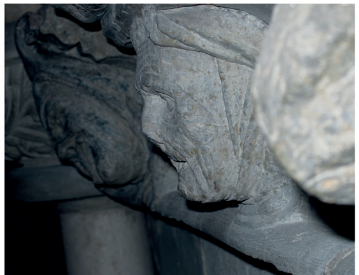
Figur 1 a) Kvinneansiktet en face. b) Kvinneansiktet i profil. Skulpturen er igjen skjult for allmennheten, som en rekke andre verdifulle kunstsatter i Nidarosdomen