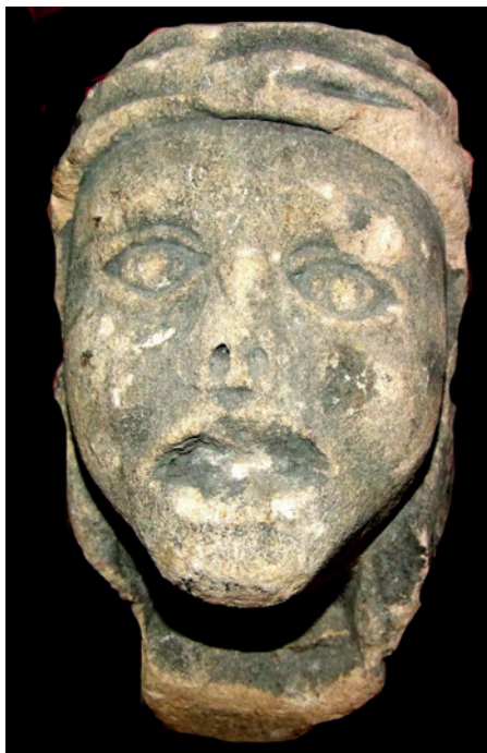
Figur 2 Kvinnehode, kalt «the leper». St. Mary's church, Melton Mowbray, England.

flertydige, blir det desto vanskeligere å komme frem til en presis diagnose og en sikker konklusjon. Intensjonen kan også gå tapt ved at man står overfor et hode i stein.