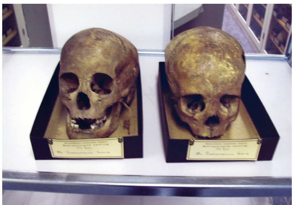
Figur 1 De aktuelle to barnas kranier og kalvarier fotografert i Anatomisk avdeling ved Universitetet i Oslo. Det bemerkes bortfall av de permanente incisiver post mortem. Alderen kan fastsettes å være den samme, 8–9 år, for begge

At «våre» to barn var begravet på klosterkirkegården, kan fortelle om varig eller midlertidig tilhørighet i klosteret. En annen orden, Augustinerordenen, hadde i sin kirkegård en avdeling for legfolk, der utenforstå-