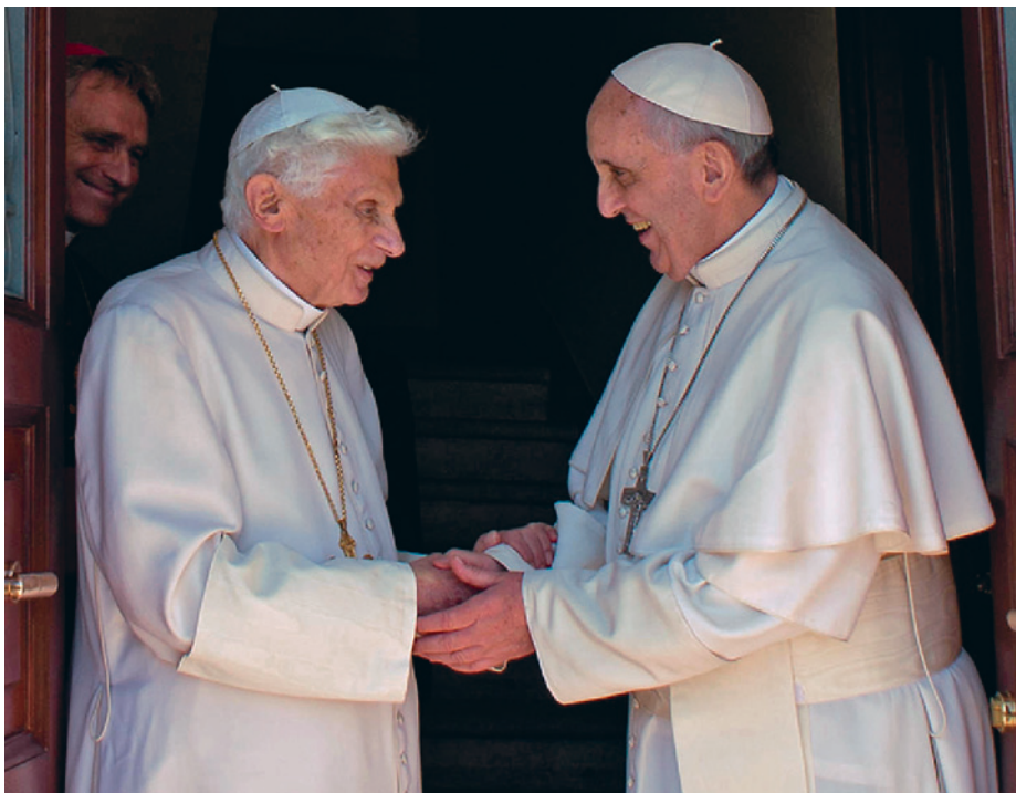
Figur 1 Pave Benedikt XVI kalles «pave emeritus» etter at han abdiserte 28.2. 2013. Det var paven selv som tok den beslutningen (2). Her er han fotografert sammen med den nye paven, Frans I, i mai 2013.