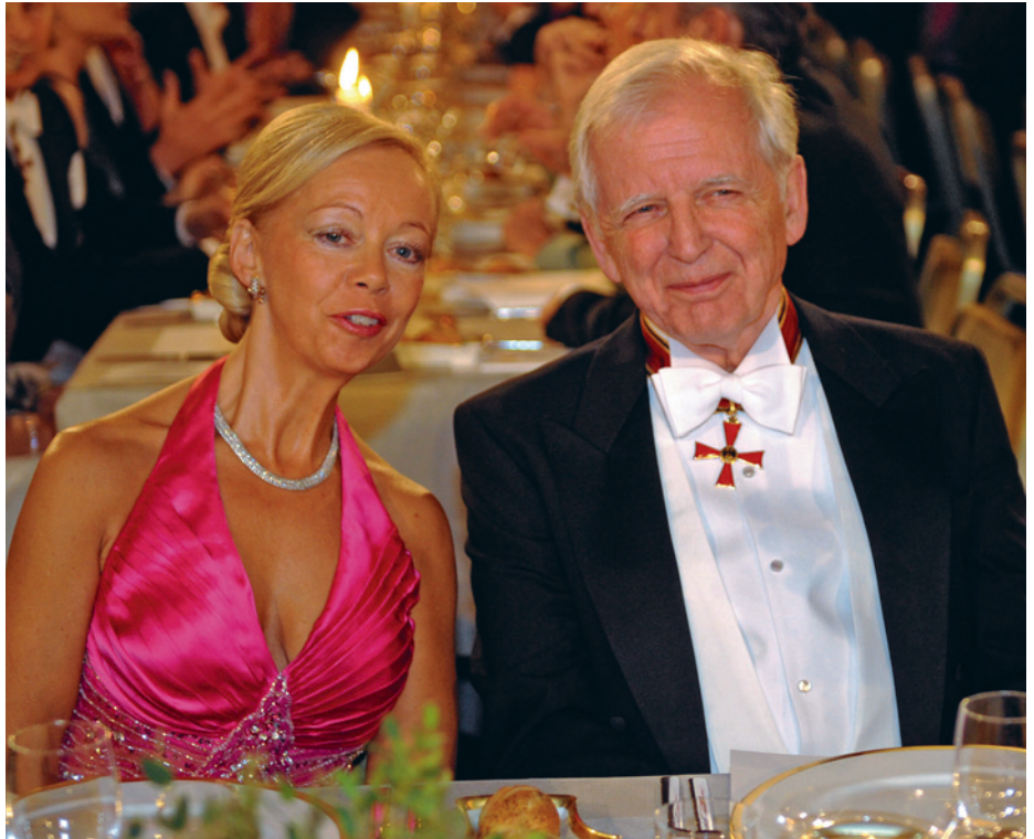
Figur 2 Gruppen professores emeriti er tungt representert blant nobelpristakere, her Harald zur Hausen (f. 1936), en av vinnerne av prisen i medisin eller fysiologi i 2008. Han fikk prisen for sin grunnleggende forskning om humant papillomvirus (HPV). Bildet viser zur Hausen med frue under festmiddagen i Stockholm 10.12. 2008.