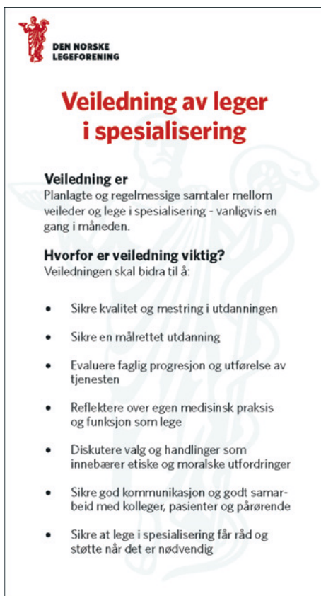
Faksimile av lommeveilederen