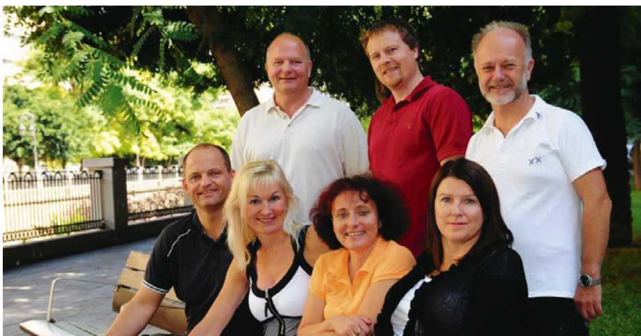
Allmennlegene er opptatt av hvordan legetjenestene i kommunene kan organiseres til det beste for barn og unge. Her representert ved styret i allmennlegeforeningen.

Se videointervju her: legeforeningen.no/derfor