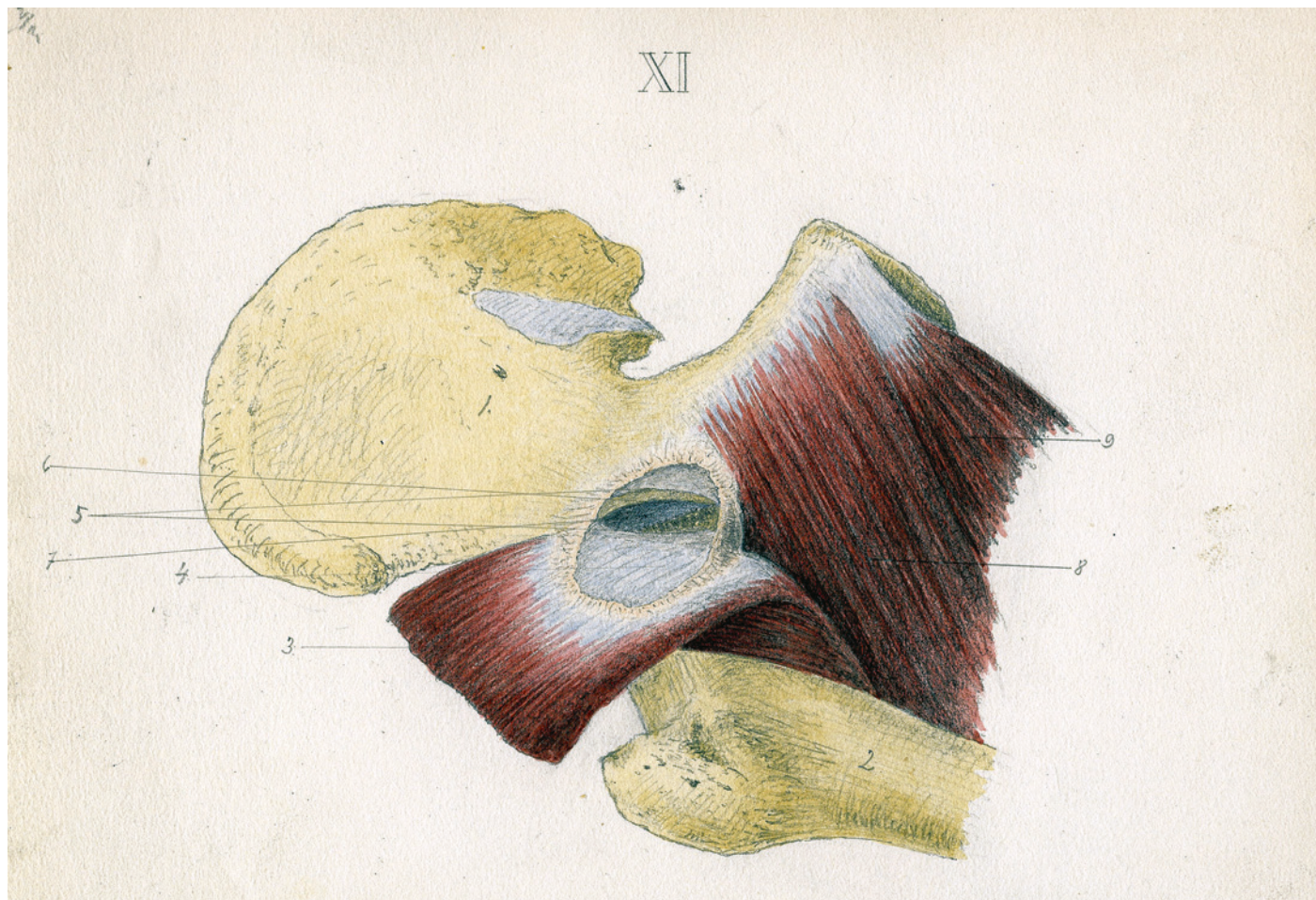
Høyre hofteldd. Her synes [3] å være m. iliopsoas , [8] m. pectineus og [9] m. adductor longus