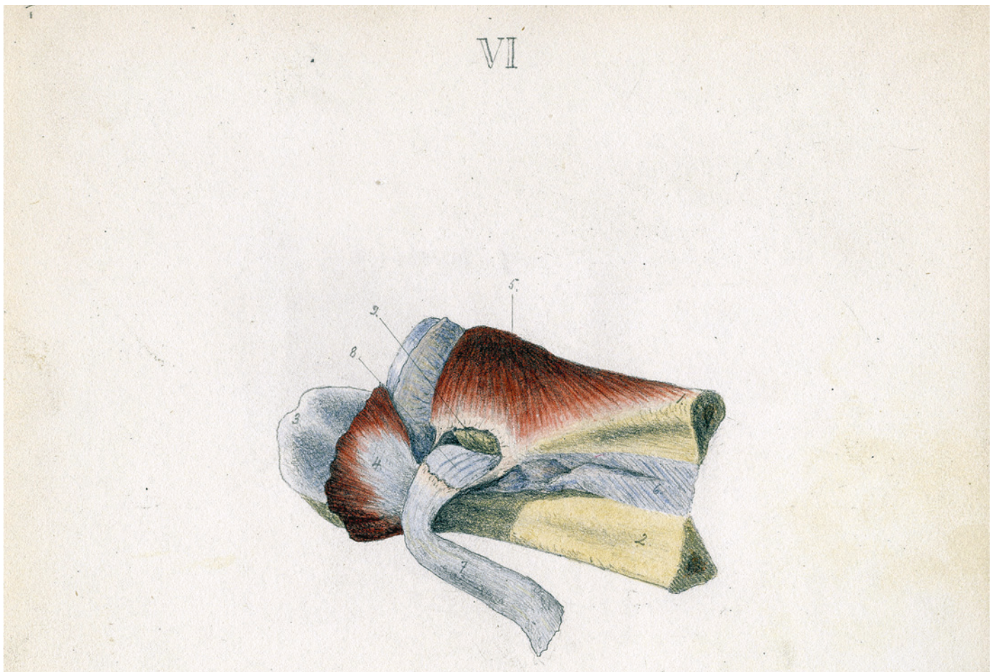
Distale del av høyre albueledd. (2) er ulna, (4) er m. brachialis, (5) m. supinator og (7) bicepsenen