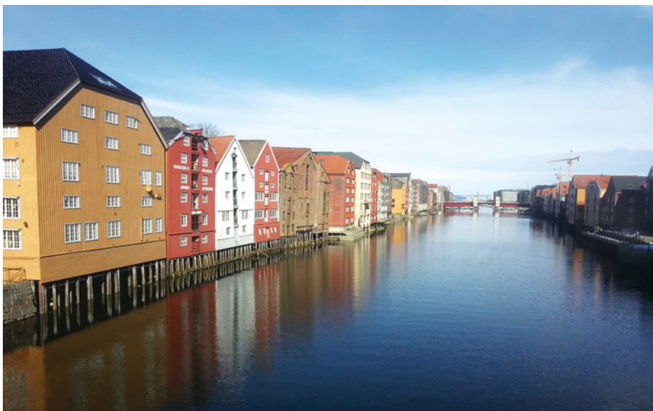
Nidelven sett fra Bybroen.

Trondheim kalles Norges teknologiske hovedstad. Byen huser 30 000 studenter og Norges teknisk-naturvitenskapelige universitet (NTNU) og SINTEF har produsert mange viktige oppdagelser og forskere. St. Olavs hospital har de siste ti årene fått erstattet gammel bygningsmasse og er blitt et moderne og tidsriktig sykehus. Det medisinske fakultet ved NTNU uteksaminerer årlig 120 studenter. Studiet som legger vekt