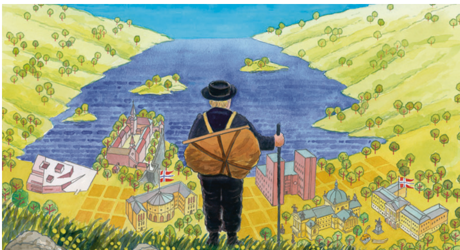
FORVENTNINGER: PMU samler fastleger fra hele landet. PMUs logo med utsyn over Oslo