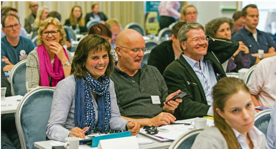
GOD STEMNING: Landsstyremøtet – møteplass for inspirasjon, engasjement og påfyll.

lise.berit.johannessen@legeforeningen.no Samfunnspolitisk avdeling