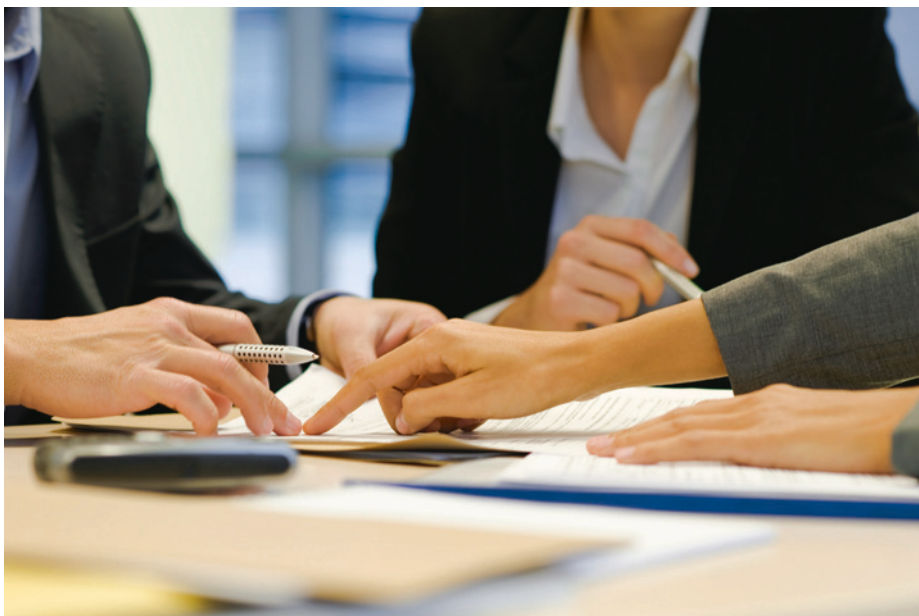
VIL SIKRE AVTALER: Vårens forhandlinger starter i begynnelsen av april.

danielwaernes@legeforeningen.no Samfunnspolitisk avdeling