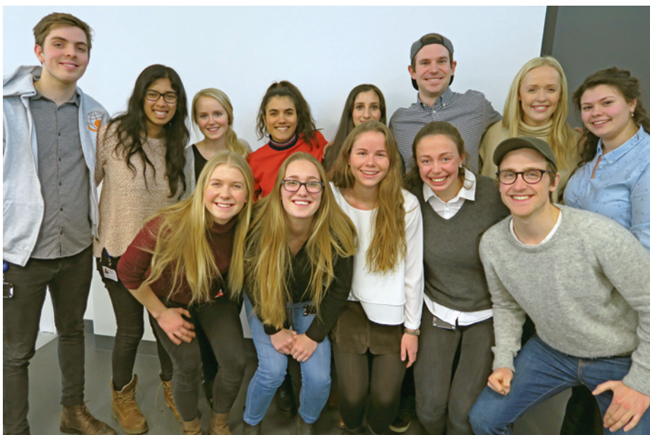
EN MUNTER OG SPENT GJENG: PR-ansvarlige for MedHum fra Trondheim, Oslo og Bergen. Tromsø-studentene var ikke til stede da bildet ble tatt.

Se videointervju her: legeforeningen.no/derfor